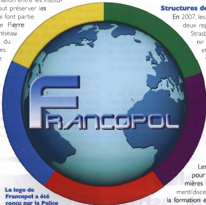
Le logo de Francopol a été conçu par la Police nationale française (PNF).

Il est à noter que le projet de création d'un réseau international francophone des écoles de police et des directions de formation policière constitue une des priorités du plan d'action 2006-2009 de la Politique internationale du Québec.