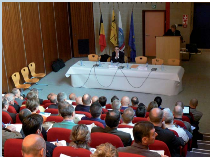
Journée d'étude "Usage de la Force"