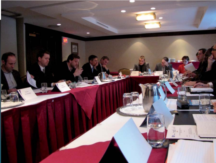
Atelier "Opérations de Paix"

FRANCOPOL et le Centre international de criminologie comparée (CICC) de l'Université de Montréal ont réuni une vingtaine de chercheurs et praticiens dans le cadre d'un atelier francophone sur la participation de la police et de la gendarmerie aux opérations de paix.